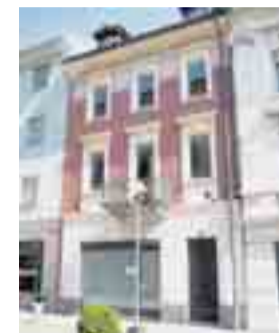
Chiasso, corso San Gottardo, al numero 44.

Dal mese di dicembre 2009 la rete di Wegelin & Co. Banchieri Privati annovera una succursale anche nel Sud del Ticino. L'apertura del ramo di Chiasso è un ulteriore capitolo nell'espansione dell'istituto, già presente a Lugano oltre che a Locarno. Anche a Chiasso, il passo è stato pianificato con cura del dettaglio e la decisione è caduta sull'edificio in Corso S. Gottardo 44. Ancora una volta la novità è legata alla tradizione ed alla storia: in-