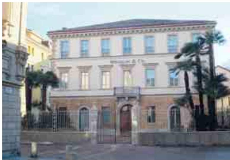
La nuova sede dell'istituto in via Canova 12 a Lugano.