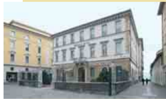
La pulizia architettonica del palazzo in via Canova.

I costi associati alla gestione del patrimonio vengono presentati al cliente sotto forma di "Total Expense Ratio" (TER), il che garantisce una trasparenza unica nel suo genere nel campo della gestione patrimoniale per clienti privati.